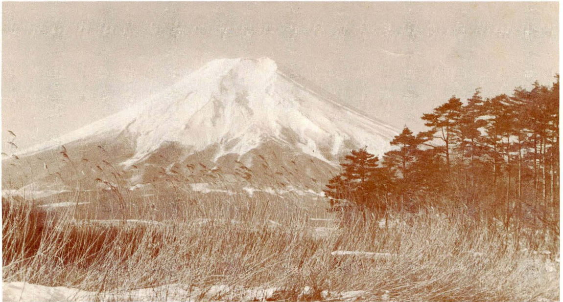
題字は大西町田税務署長