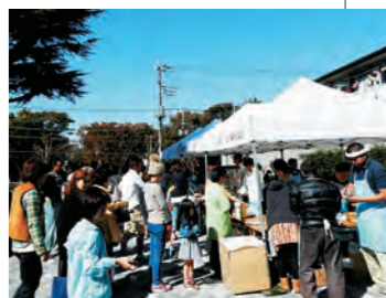
左=町田セルビアアチアリーディングスクールFINESの躍動感溢れるチアリーディング 右=好天に恵まれ、屋外のブースも賑わいを見せた