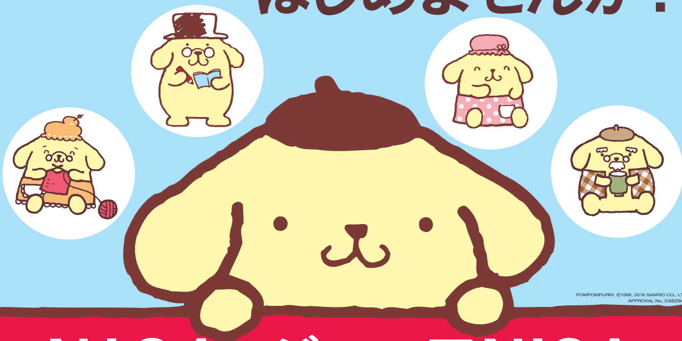
POMPOMPURIN ©1996, 2016 SANRIO CO., LTD. APPROVAL No. G562949