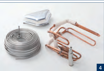
1 1995年頃の創業者・収三氏と緑氏 2 新潟工場では主に給湯器のパイプ加工を行う 3 タイ工場では従業員と 4 車両、給湯器、家電、医療ほか様々な分野でのパイプ加工を行っている