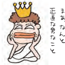
まあ、なんと正直な男なこと

女神は感心して、たっぷりのご褒美を男にくれました。男の会社は無事、おカネを借りることができました。