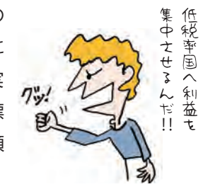
低税率国へ利益を集中させるんだ!!

おじいさんは、しばらくうなづいていましたが、ある疑問を口にします。「タックスヘイブンで節税...そこまでしておカネを貯めて、わしらはどうなる?」