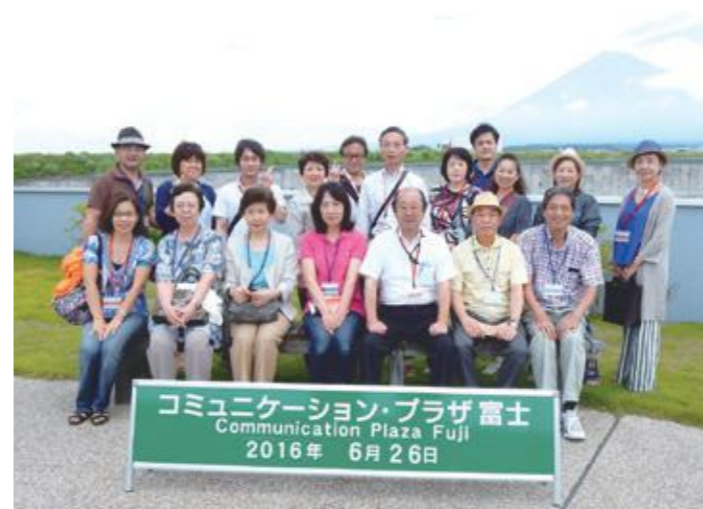
上) 変化に富んだ荒川の急流で作られた「岩畳」は年間200万人が訪れる国の特別天然記念物 中) 緩やかな場所も急流も楽しめる長瀬ライン下りでは水しぶきで濡れる人も 下) 美しい富士山をバックに中町支部の皆さん

各支部で開催されているバス研修会は様々な目的や多彩なコースで多くの会員が参加する人気の会員交流活動。 小山支部 では6月19日、「長瀬ライン下りとシイタケ狩り」酒蔵見学と「バーベキュー」を実施。大人26名、子ども5名が参加した。まず、親鼻橋から2槽の舟に分かれ長瀬ライン下り。続いて椎茸狩りを楽しみ、昼食は溶岩から発せられる遠赤外線焼く溶岩BBQ。ジュシーで美味しい肉や椎茸、きのこ汁を堪能し、酒蔵「八尾本店」酒づくりの森へ。製造工程の見学や秩父錦をはじめ辛口や甘口、にがり酒に焼