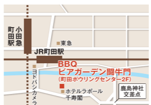
飲み放題、食べ放題で料金は1人4,200円。時間は2時間制。