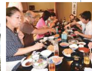
左) 仕込み水に富士山の伏流水を豊富に使うという酒蔵では試飲も楽しんだ 右) 昼食は由比の人気店、井筒屋で。駿河湾特産、桜えびのかき揚げはふんわりサクサク、揚げたての美味しさ