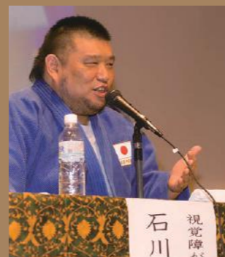
左)5月に行われたまちだ市民大学の公開講座 中)練習は大学などの道場を借りて行う 右)思い出と実績が刻まれたメダルや記念のパネル