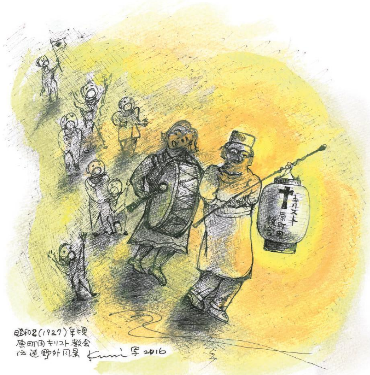
昭和2(1927)年頃 原町田基督教 伝道野外風景 Kuni 画 2016

私が七歳頃だったから、もう九十年前のことになる。日曜の日暮れどきになると、決ってドラムの音が響いてきて、白い大きな提灯をかけたガクタイがやってきた。提灯をかがけているのは牧師さんで、我が家の裏通りで毎日食糧用のニワトリの首をひねっているお店のオジサンだった。すぐ後ろでドラムを叩いているお姉さんは知らない人で、「……信ずる者は救われ……」とドラムに合わせて唄ってみせた。