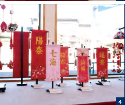
1 八王子バイパスと町田街道交差点にある本店 2 衣裳着の人形よりも少し小ぶりの木目込みの雛人形 3 所狭しと並ぶお雛様。人形と道具類の組合せを変えてくれるのも、東芸ならではの 4 名前を入れた名旗(名前旗)も様々な種類がある

COMPANY PROFILE 有限会社 寿鳳人形の東芸 創業 昭和41年9月1日 従業員数 5名 資本金 300万円 東京都町田市相原町597-11 042-771-8576 https://www.juho-tougei.com/