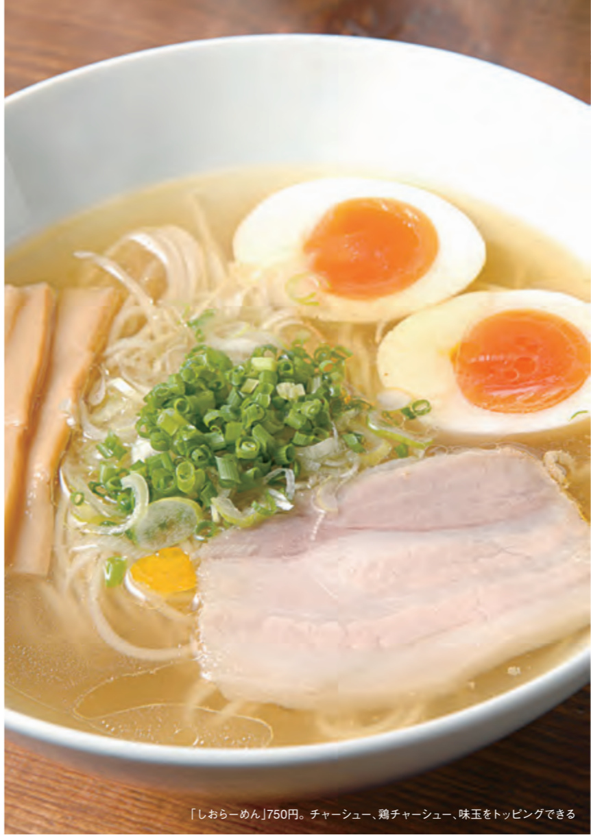
「しおらーめん」750円。チャーシュー、鶏チャーシュー、味玉をトッピングできる

町田汁場しおらーめん 進化 町田市森野3-18-17ウイング森野103 042-705-7122 月～土11:00～15:00・18:00～21:00 日祝11:00～17:00 年中無休 https://ameblo.jp/shinka-shio/