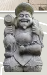
大黒天 五穀豊穡の神様。大きな袋を背負い、右手には内出の小槌を持った姿でお馴染み