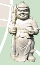
毘沙門天 戦いの神様。仏教守護神四天王の一人で甲冑をつけ宝塔を持つ