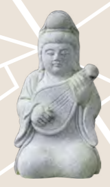
弁財天 芸術才福の神。七福神の中で唯一の女神様