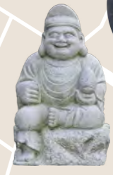
恵比寿 商売繁盛の神。七福神の中で唯一の日本の神様