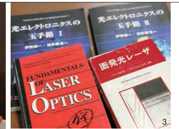
■2013年4月23～25日、米国フィラデルフィアで行われたフランクリン賞の授賞式で輝々たる研究者たちと(左から4人目) 町田フィルハーモニー交響楽団の首席コントラバスを歴任した伊賀博士。町田フィルバロック合奏団の主宰者でもある。著書は15冊以上、論文の数も450以上にのぼる。最近も、「面発光レーザーが輝くVCSELオデッセイ」を上梓した