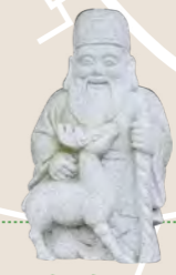
寿老人 不老長寿の神。老子の化身とも云われる