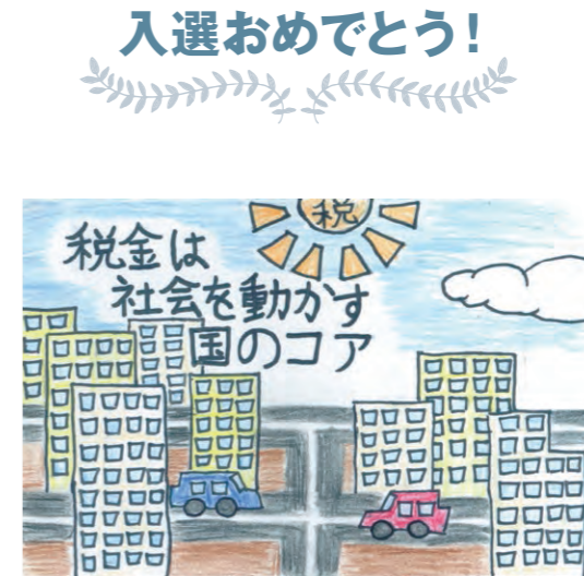
東京都八王子都税事務所長賞