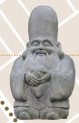
福祿寿 財宝守護の神。福(繁栄)・禄(財産)・寿(長寿)の三徳を備えている

トロイ遺跡の発掘で知られるハインリッヒ・シュリーマンが、慶応元年(1865)世界漫遊の途中、日本滞在中に訪れた旅館「吉田屋」があった場所。