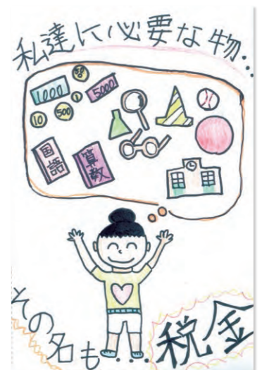
町田税務連絡協議会優秀賞