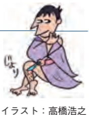
イラスト：高橋浩之

ウェブログ好評開設中! 「社長の為のじょりじょりわかる 税理士ブログ」 http://taxjolly.hatenablog.com/