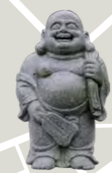
布袋尊 家庭円満の神。弥勒菩薩の化身とも伝わる