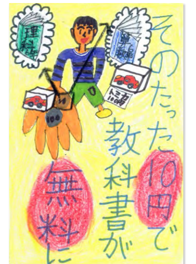
町田税務連絡協議会優秀賞