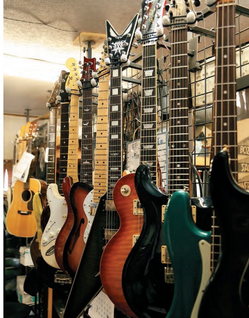
修理作業中の各メーカー製エレキギター達。様々な国で製造されているが精度の高い日本製パーツの採用は多い。

私がよく見る素人の作品というのは完成を目標としていないものが多い様に思える。例えばそのへんに木片が転がっているからそれを使って何かを作る人がいるとする。その場合がまさにそうだ。子供の作るものではそんなものも多く、不完全であつてもそのストーリーは面白いなあと感じることもある。