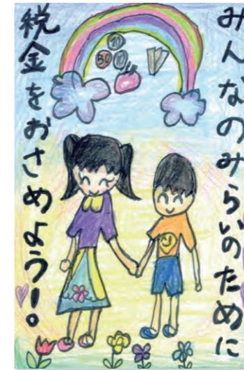
東京都八王子都税事務所長賞