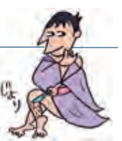
イラスト: 高橋浩之

「社長の為の じょりじょりわかる 税理士ブログ」 http://taxjolly.hatenablog.com/