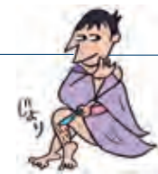
イラスト: 高橋浩之

「社長の為の じょりじょりわかる 税理士ブログ」 http://taxjolly.hatenablog.com/