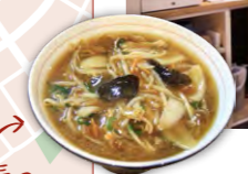
一番人気のサンマメン