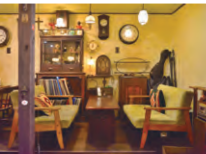
ヴィンテージ家具や雑貨に囲まれて ゆったりと自分時間を楽しめる

高度成長期にできた団地は サラリーマンたちの憧れで、町田 最大規模の鶴川団地もその例 外ではなかった。入居倍率は何 十倍にも及び、駅へ向かうバス 停には毎朝長蛇の列ができた という。近年では建物の老朽 化や居住者の高齢化が進むが、