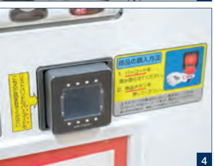
1 南町田の本社ビル 2 在宅勤務が推奨されている、コロナ禍の社内風景 3 PCなどの備品管理を目的としたICカード認証のセキュリティBOX 4 様々な施設でキャッシュレス化が実現できるバーコード／ICカードリーダー。リストバンドや社員証を用い情報管理する仕組み