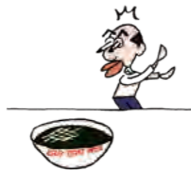
表面真っ黒の得体のしれない食べ物ができあがった(でも、かすかにラーメンの面影をのこす)。

貼るべき契約書などに印紙を貼っていないときは、過怠税なる税金が追徴されます。過怠税は本来貼るべき印紙の3倍(※)。