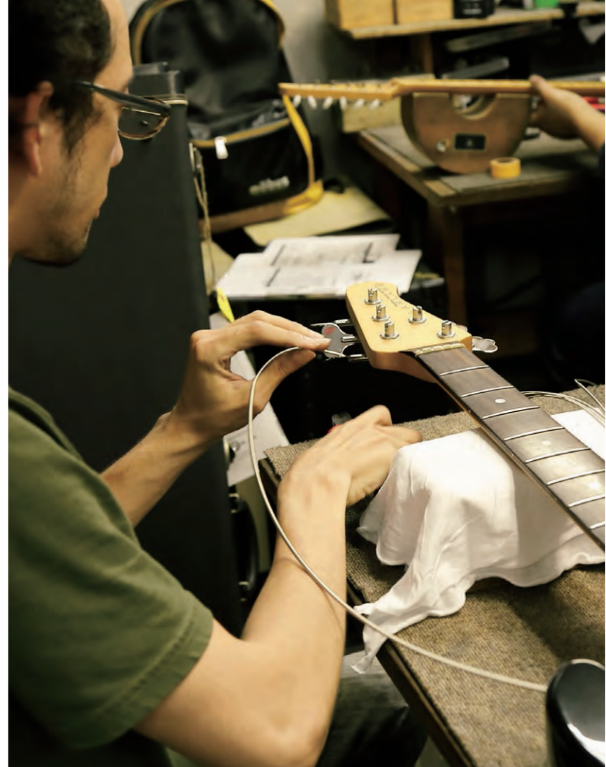
同じ作業でも指先の使い方、時の支点など職人によってそれぞれ個性を感じる

広い意味で職人というジャンルがあるが、新品を作る職人と修理をする職人がいるが理念や性質が異なっている。