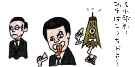
印紙と切手の貼り間違いには、ご注意ください。

長い道のりです。会社と税務署そして郵便局の位置関係によっては一日仕事になるかもしれません。