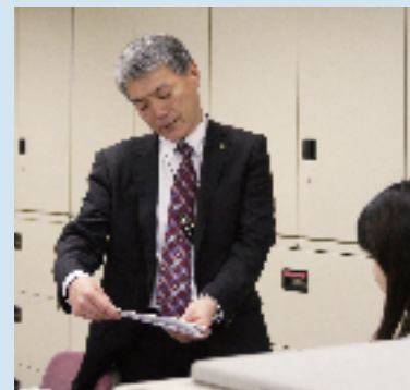
会社と各店舗、取引先を飛び回る忙しい毎日。写真上は社長室、下は本社オフィス2階での1カット。