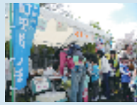
町田法人会のテントに並ぶ沢山の子どもたち。恒例になっている一億円レプリカの重さ体験に、子供たちだけでなく、大人からも驚きの声。