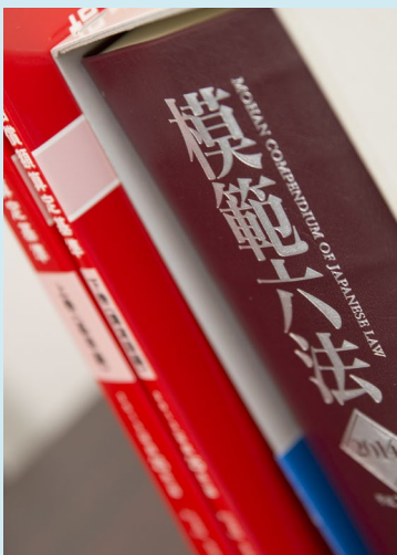
町田市根岸生まれのおじい様と原町田生まれのお父様も、二人とも町田育ちという守屋さん。どんな事件でも依頼者を信じて相談に耳を傾ける。

「Q」今、弁護士さんが多くて就職できない方も沢山いると聞いていますが、就職して独立するって理想的ですよ。そのあたりのいきさつを教えてください。 「A」元々いつかは独立したい、独立するから「町田」じゃない、って決めていたんです。就職については都内の法律事務所という選択肢もあつたんですが、たまたま2009年に町田に新しい法律事務所が出来た、しかも独立したい弁護士を養成する、しかも独立したい弁護士を養成するというコンセプトもあるというので、独立を視野に入れてそこに就職しました。4年間、その法律事務所にはいたんですが、最初は所属事務所から振られる仕事が始まりました。でも、次第に自分の繋がりや依頼される事件が多くなってきました。例えば債権回収をした会社からの依頼を個人で受けるようになる一方で、所属事務所での依頼者の多くは債務整理を依頼してくるというケースが多くなってきます。すると、いずれ回収を求める側とされる側、双方から相談を受けて、両方断らざるを得ないことにもなりかねません。そのようになりスクの回避と、あとは自分で処理