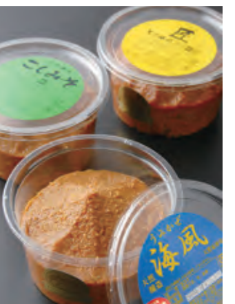
海風1,160円、こしみそ660円、匠770円 (いずれも450g)

糀屋がルーツの井上糀店は、長い歴史の中で酒や醤油、味噌などを作ってきた。正確な創業年は不明だが、製造した酒の瓶